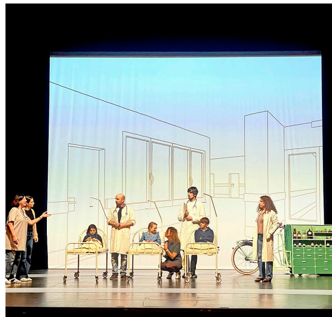
Ein erster, exklusiver Einblick in die Theaterproben der «Kleinen Bühne» auf der Bühne des Schaffhauser Stadttheaters.