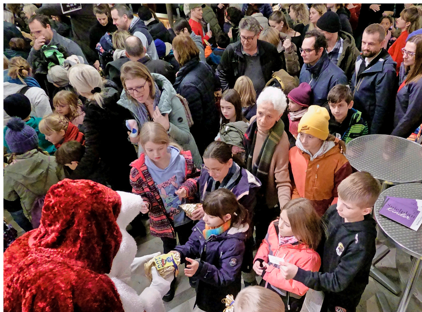
An der TCS-Vorstellung – die nicht nur den Mitgliedern des Mobilitätsclubs offensteht – wartet im Theaterfoyer nach der Vorstellung ein Chlaussäckli auf die Kinder.

TCS-Vorstellungen vom 8. Dezember: öffentlicher Vorverkauf bis 6. Dezember, am 7. Dezember an der Tageskasse. Alle Kinder erhalten ein TCS-Chlaussäckli.